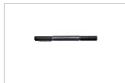
スタッドボルト ミスミ