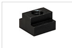
Tスロットナット ミスミ