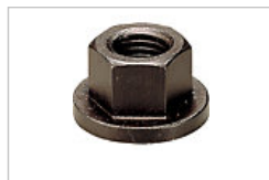
フランジナット ミスミ